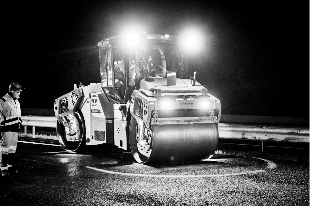
Mise en œuvre des enrobés