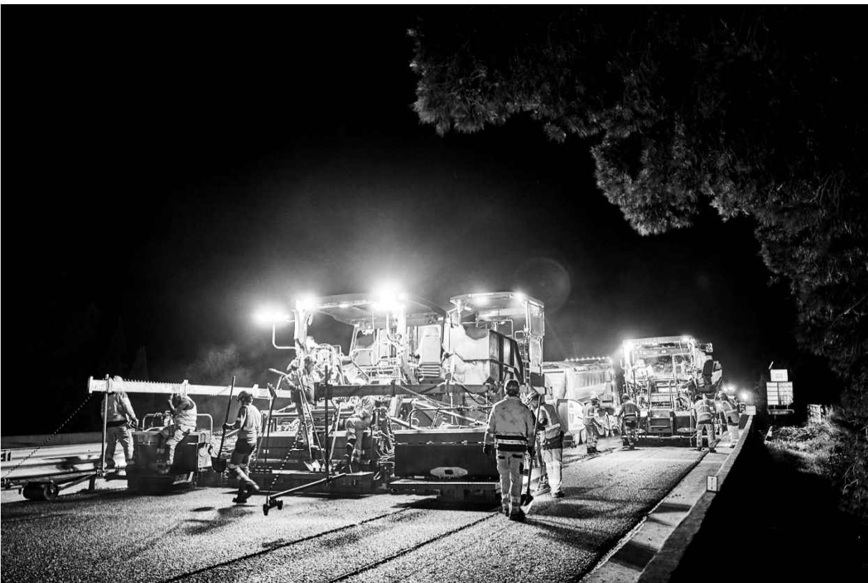
Application des enrobés neufs